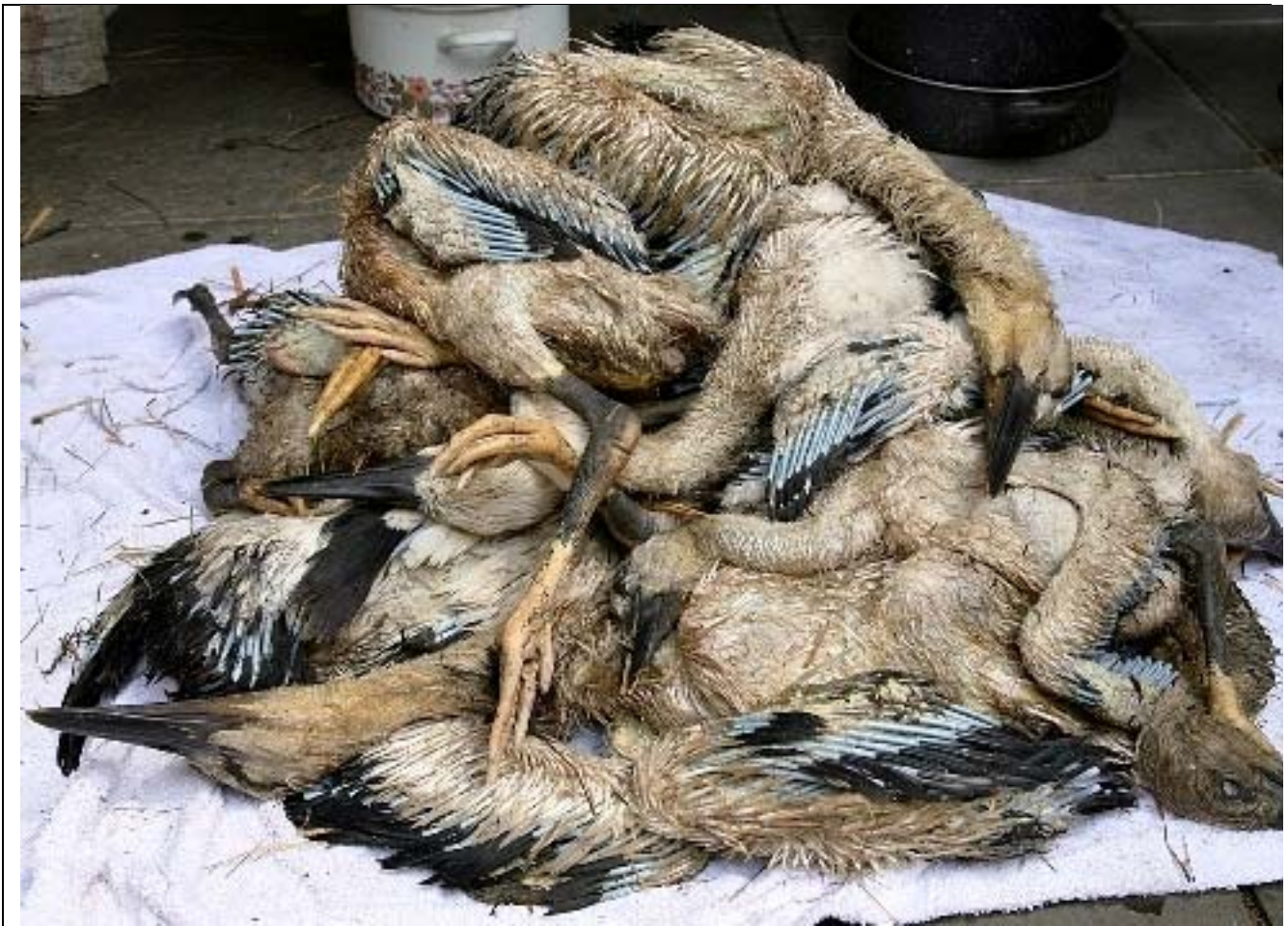
[36: Pfingsten 2007, kalter Dauerregen und die verheerenden Folgen]