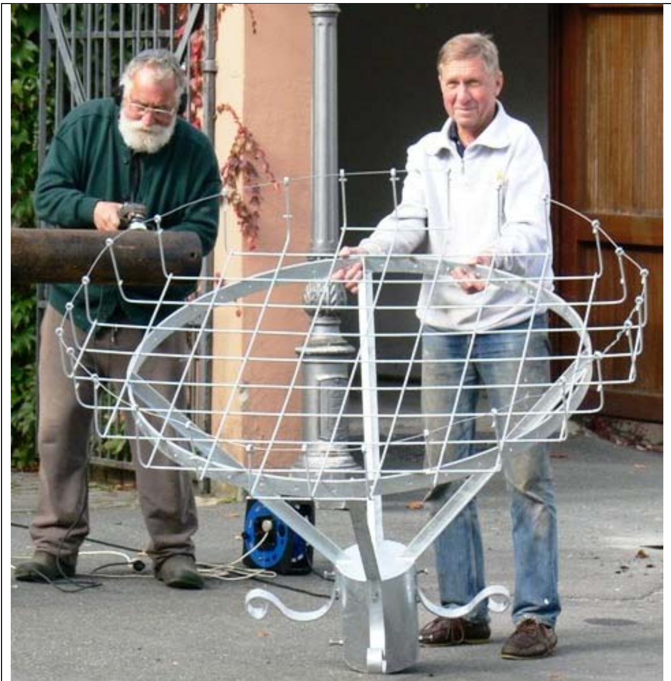
[34: Extrem wasserdurchlässige Nestunterlage]