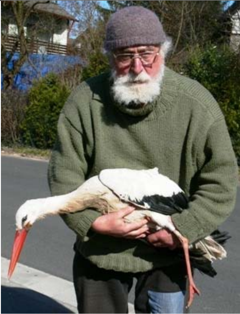
[43: Twentys letzte Reise]