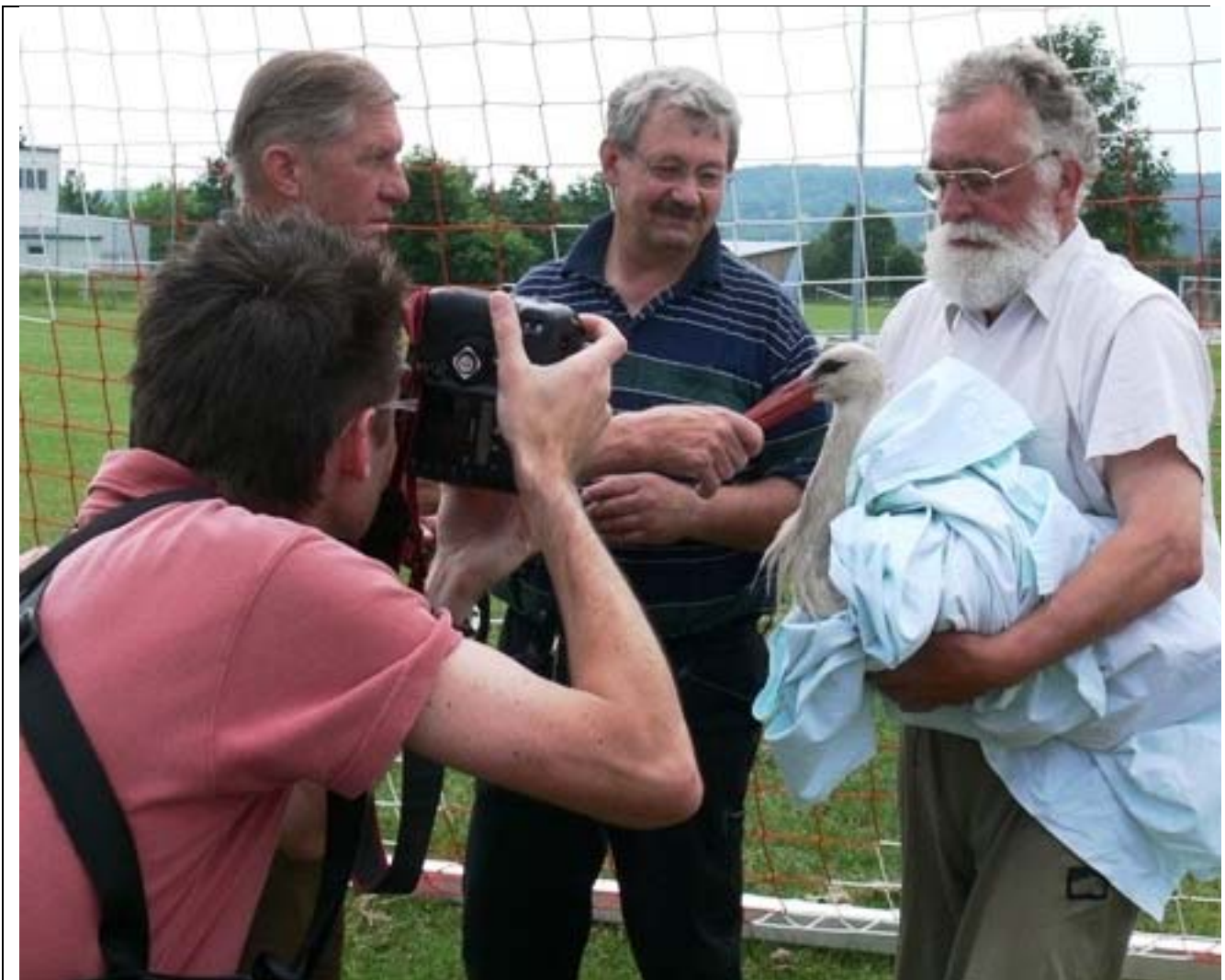
[38: Das Storchenmännchen von der Berufsschule Forchheim mit Flügelbruch]

Nürnberger Tiergarten zur Handaufzucht bzw. zur Heilbehandlung. Das war gerade im Höhepunkt der Vogelgripenhysterie und der Zoo war behördlich gehalten, alles was eingeliefert wurde, einzuschläfern. Ich erfuhr das gerade noch rechtzeitig, packte meine Ladung wieder zusammen und suchte mir einen privaten Tierarzt für die Bruchbehandlung. Die Brut nahm ich mit nach Hause, bis ich geeignete Ammenbruten fand und horstete sie dort ein. Das war in kurzen Worten eine ziemlich lange Geschichte. Wesentlich war die Reaktion Bayreuths (obere Naturschutzbehörde bei der Regierung in Oberfranken). Praktisch zeitgleich mit Ansbach entdeckten auch sie bei mir den Charakterdefekt „Unzuverlässigkeit“, weil „eine Storchenbrut aus dem Nest geholt wurde“. Das Drum und Dran wurde großzügigerweise weggelassen und Michel flog raus!